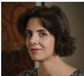
Par Sarah Guéreau Associée Crowe Horwath Dauge et Associés

“ La RSE constitue un levier de compétitivité efficace et un axe de développement. ”