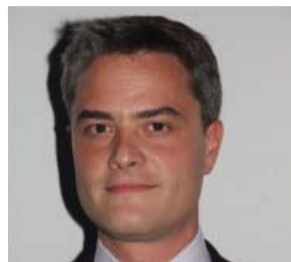
Par Jean-Baptiste Cottencaeu Associé Crowe Horwath Sustainable Metrics

À l'heure de la COP 21 à Paris, tout a été dit, ou presque, sur la hausse du thermomètre mondial, signe du changement climatique en cours, et sur l'absolue nécessité de modifier nos habitudes afin de réduire nos émissions de carbone. Nous le savons, cela passe par le développement de sources d'énergies alternatives aux énergies fossiles. Cela passe aussi et, plus largement, par un changement d'état d'esprit pour inscrire nos activités dans une